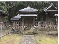
上杉鷹山の墓=米沢市の上杉家廟所

さて、一番人気の藩主は誰でしょうか。上杉家廟所で、受付をしていた男性に伺いました。米沢市では、藩祖の謙信、米沢初代の景勝をしのぎ、10代藩主上杉鷹山こと治憲が一番の人気者だそうです。 上杉家は会津時代、その石高は120万石。米沢では表高30万石。収入が4分の1に減ったのに、景勝は6,000人の家臣をそのまま米沢に連れていきましした。その後、石高は15万石に減らされました。米沢藩の貧乏ぶりは、江戸の町民からも揶揄された