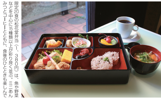
限定20食の松花堂弁当(1,380円)は、魚や野菜などを中心に15種類以上が彩り豊か。ミニあんみつ(100円)も、食後のひとときも楽しんで