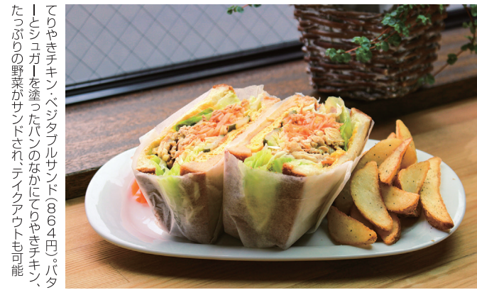
てりやきチキンベジタブルサンド(864円)。パターとシユガーを塗ったパンのなかにてりやきチキン、たっぷりの野菜がサンドされ、テイクアウトも可能